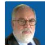
MIGUEL ARIAS CAÑETE