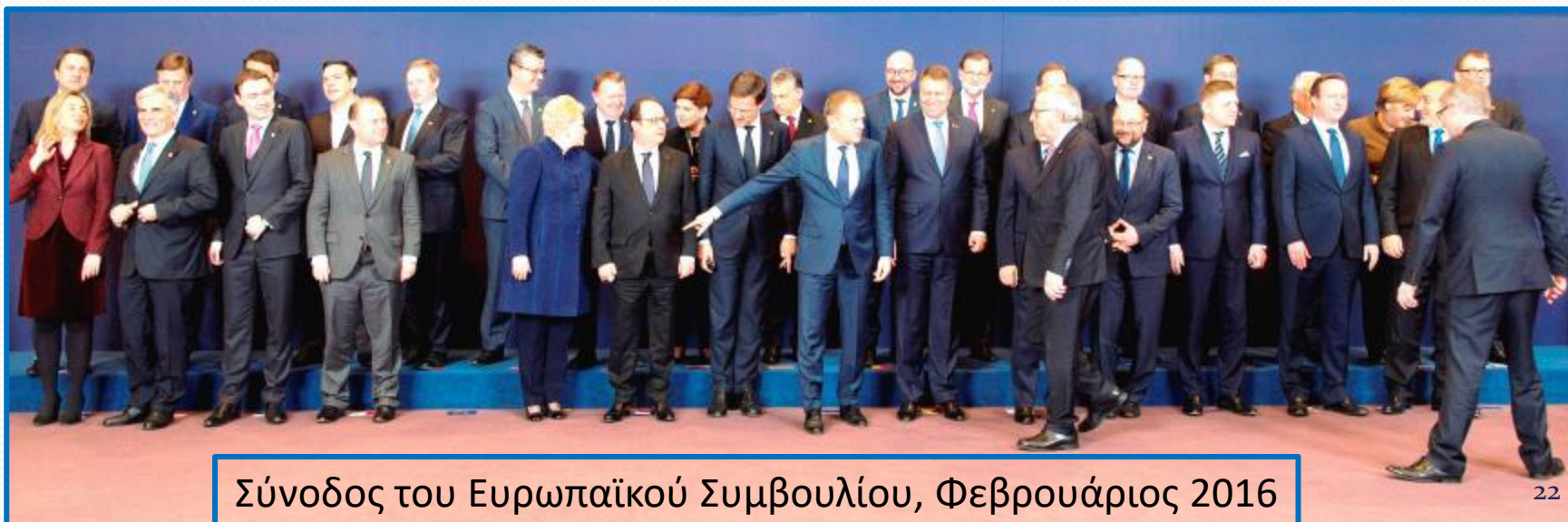
Σύνοδος του Ευρωπαϊκού Συμβουλίου, Φεβρουάριος 2016

Στο Ευρωπαϊκό Συμβούλιο συνέρχονται όλοι οι ηγέτες των χωρών της Ε.Ε (πρόεδροι, πρωθυπουργοί ή καγκελάριοι), για να χαράξουν τη γενική στρατηγική της Ευρώπης.