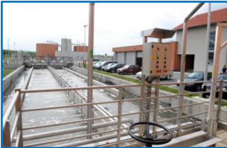
Μονάδα επεξεργασίας λυμάτων στην Κροατία, που χρηματοδοτείται με τη βοήθεια κονδυλίων της ΕΕ

Η ΕΕ παρέχει χρηματοδότηση σε συγκεκριμένα έργα για την αντιμετώπιση των αναγκών αυτών.