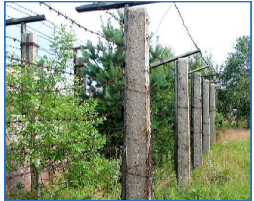
Απομεινάρια του σιδηρού παραπετάσματος στην Τσεχική Δημοκρατία

Οι χώρες που είχαν επανακτήσει την ελευθερία τους προχώρησαν σε μεταρρυθμίσεις των νόμων και των οικονομιών τους και προσχώρησαν στην ΕΕ. Η ΕΕ έχει σήμερα 28 κράτη μέλη.