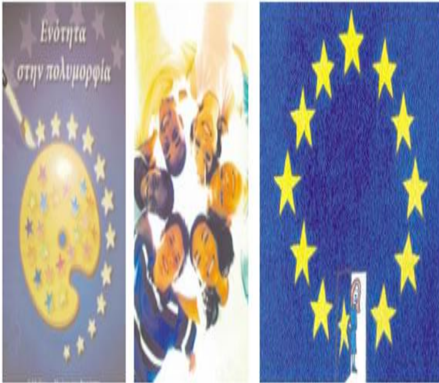
φωτ. 3.1, 2, 3 Ευρωπαϊκή Ένωση: Ενότητα στην πολυμορφία